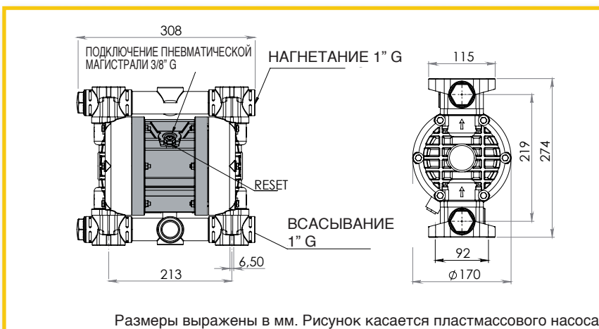
Размеры выражены в мм. Рисунок касается пластмассового насоса